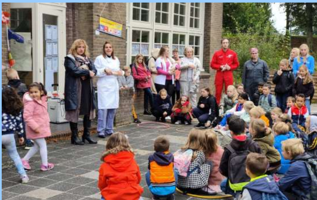
Onder grote hilariteit van de kinderen waren de juffen verkleed in een ander beroep.

7 oktober 2021, 14:57 • Steenwijker Courant